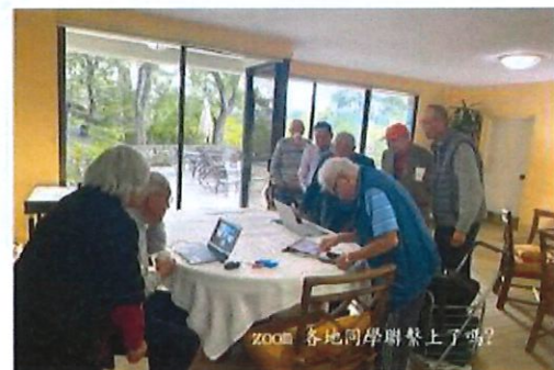
zoom 各地同學聯繫上了嗎?