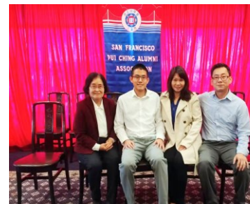
獎學金得主(白衣)與父母及祖母