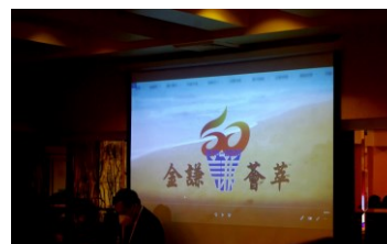
謙社學長們有備而來、有社旗牌又有視像