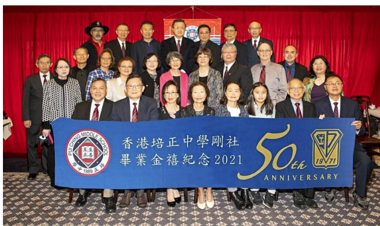
剛社學長們掛牌前、跟 社 嫂姑爺們合照、仔仔一堂